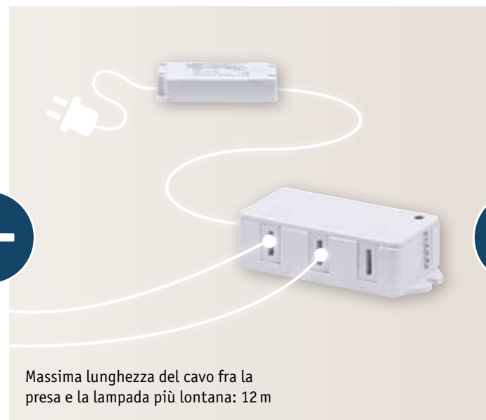
Massima lunghezza del cavo fra la presa e la lampada più lontana: 12 m