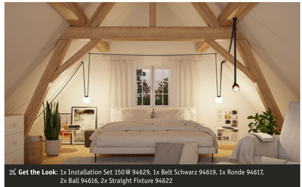
Get the Look: 1x Installation Set 150 W 94629, 1x Belt Schwarz 94619, 1x Ronde 94617, 2x Ball 94616, 2x Straight Fixture 94622

Uline setzt dadurch völlig neue Maßstäbe in der Gestaltung moderner Wohn- und Arbeitsräume.